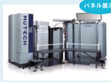
(株) ミューテック 高積紙揃機 ミューバイルジョガー