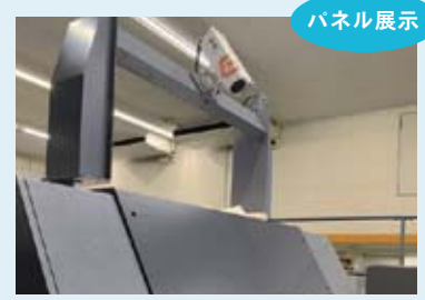
ジクス(株) オフセット印刷品質検査装置 Lab-vision

新世代 AI 協働ロボットによる人手不足への対応や作業者の負担を大幅に軽減する機器のご提案で皆様への働く環境改善のお手伝いを致します。また、中小企業省力化投資補助金をはじめとする各種補助金のご提案、サポートで導入支援も致します。