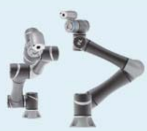
(株)山善 新世代 AI 協働ロボット TECHMAN ROBOT