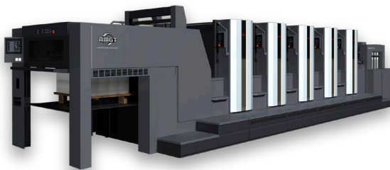
B1判5色オフセット印刷機 RMGT 1050V1ST-5+LED-UV+PQS-D