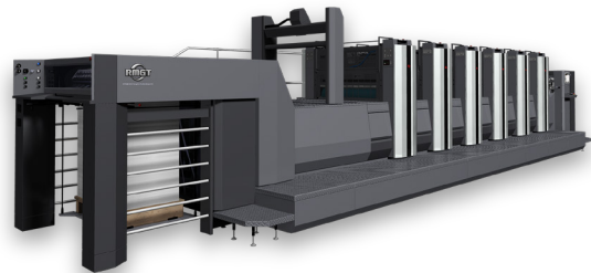
菊全判5色オフセット印刷機 RMGT 970ST-5+CC+LED-UV+PQS-D